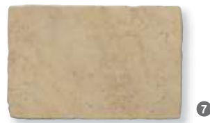
Antiqua Noce 32,5x49