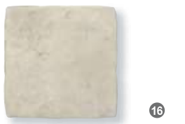
Antiqua Bianco 32,5x32,5