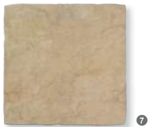
Antiqua Noce 49x49