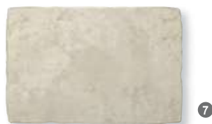
Antiqua Bianco 32,5x49