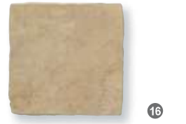
Antiqua Noce 32,5x32,5