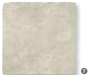
Antiqua Bianco 49x49